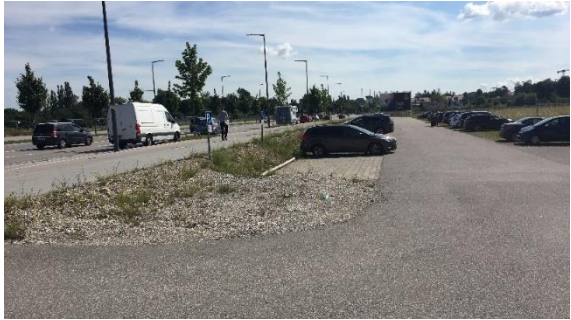
Nordseite Behinderten-Stellplätze auf P+R südlich Bodenseestr.