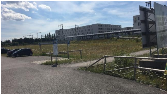
Nordseite Rampe nach oben von P+R südlich Bodenseestr.