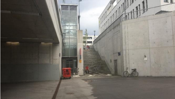
Südseite Aufzug Unterführung