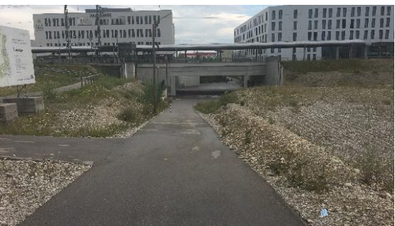
Nordseite Rampe/Weg nach unten von P+R südlich Bodenseestr.