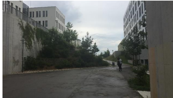
Südseite Rampe nach unten von Clarita-Bernhard-Str.