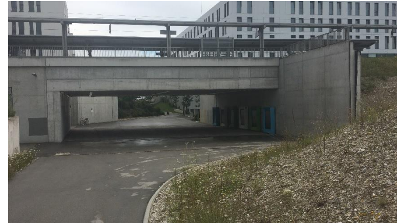
Mögliche Flächen für Behinderten-Stellplätze in der Unterführung, direkt an den Aufzügen